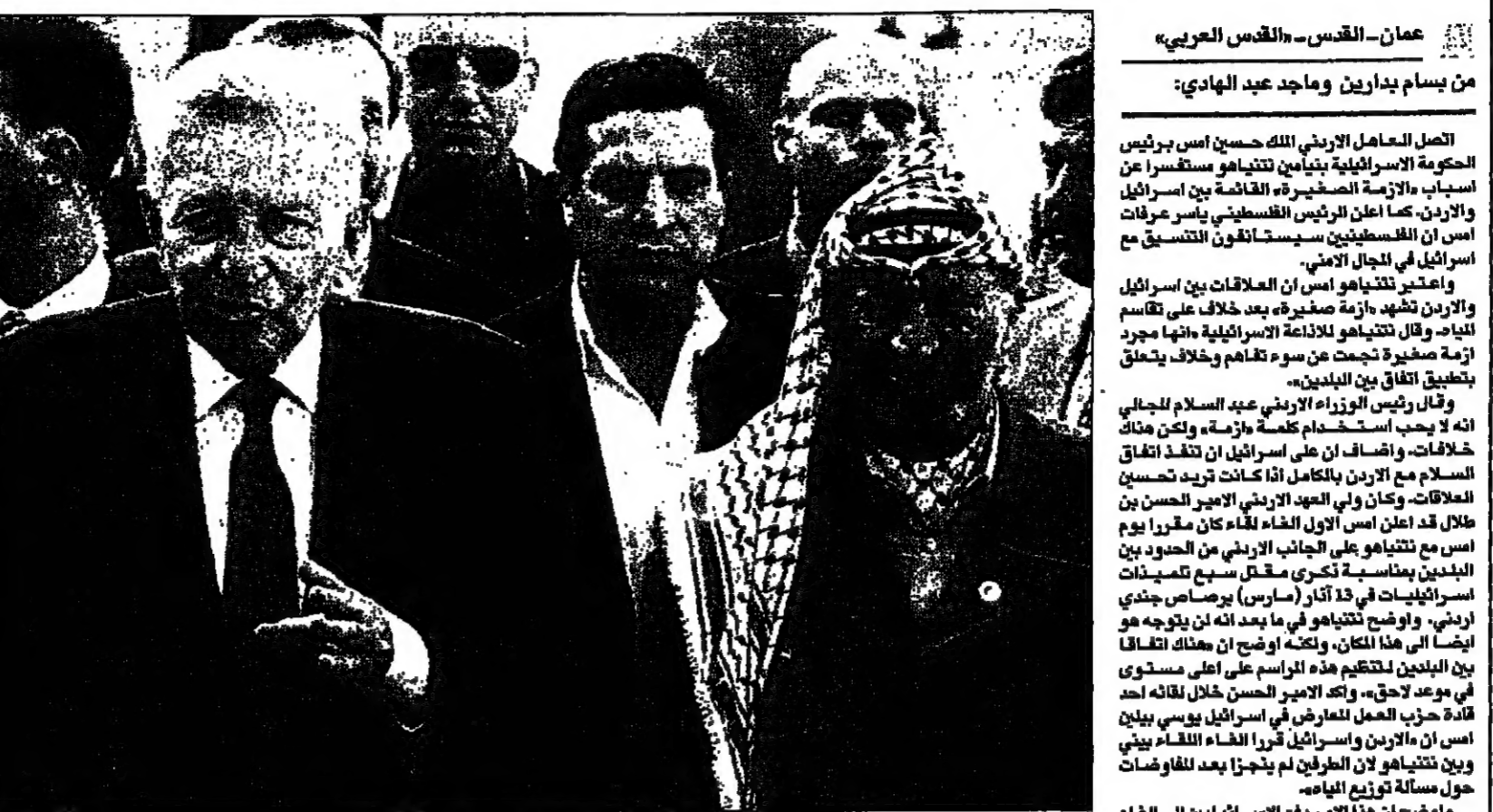
عرفات ورئيس الوزراء اريئيل شارون مع الملك الحسين في عمان.

عمان - بالقدس العربي: أعلن الملك الحسين بن عبد الله الثاني في عمان، انه قد وافق على استئناف التنسيق الأمني مع إسرائيل، وذلك بعد اجتماعه مع رئيس الوزراء الإسرائيلي اريئيل شارون في عمان. وقال الحسين ان هذا القرار، هو نتيجة لاجتماعات عديدة، وانه يهدف الى تعزيز العلاقات بين البلدين، وتحقيق الاستقرار في المنطقة. وأضاف الحسين ان التنسيق الأمني، هو خطوة مهمة، نحو تحقيق السلام في الشرق الأوسط. وأشار الحسين الى ان التنسيق الأمني، سيشمل تبادل المعلومات، وتنسيق العمليات الأمنية، وتدريب القوات المسلحة في البلدين. وأكد الحسين ان التنسيق الأمني، سيشمل أيضا، تبادل المعلومات، وتنسيق العمليات الأمنية، وتدريب القوات المسلحة في البلدين.